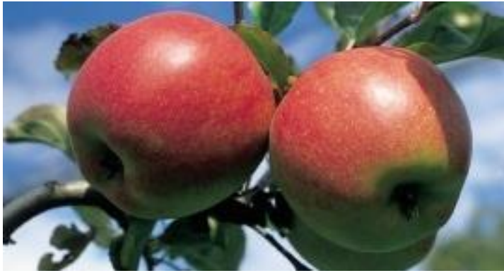
Ariwa Lagerfähige Tafelsorte

Saftig aromatischer Apfel mit orangeroter Farbe