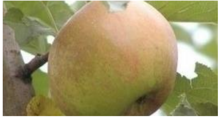
Boskoop Lagerfähige Tafelsorte Mostapfel

Saftiger, mittelgrosser Apfel, gut zum Kochen geeignet