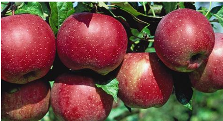
Florina Tafelsorte Mostapfel

Knackiger, süss-säuerlicher Apfel mit roter Farbe