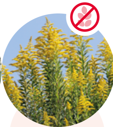
Nordamerikanische Goldruten Solidago canadensis und gigantea

Herkunft: Ostasien Blütezeit: Juli bis September