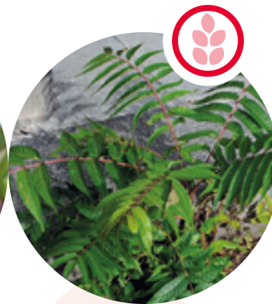
Götterbaum Ailanthus altissima

Herkunft: Nordamerika Blütezeit: Mai bis Juni