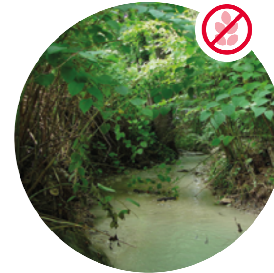
Asiatischer Staudenknöterich verdrängt Vegetation am Bach.

Helfen Sie mit und entfernen Sie exotische Problempflanzen aus Ihrem Garten, damit sich diese nicht unkontrolliert in die Nachbarschaft und in natürliche Lebensräume ausbreiten.