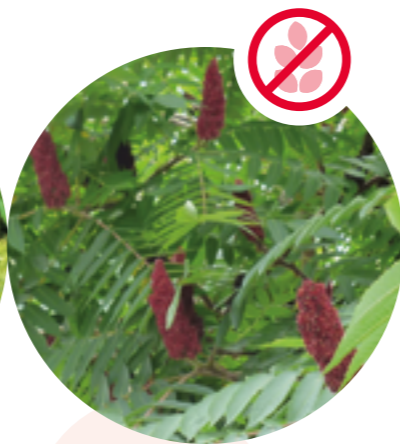
Essigbaum Rhus typhina

Herkunft: Kaukasus Blütezeit: Juli bis September