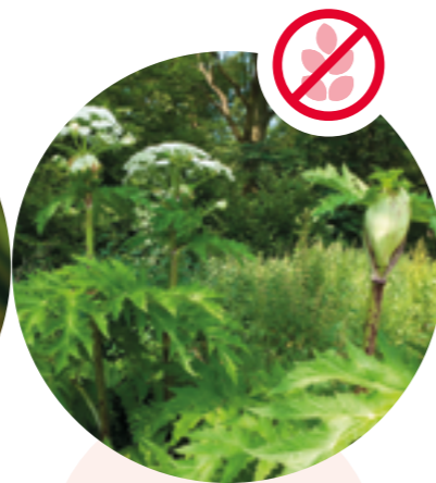
Riesenbärenklau Heracleum mantegazzianum

Herkunft: Himalaja Blütezeit: Juli bis September