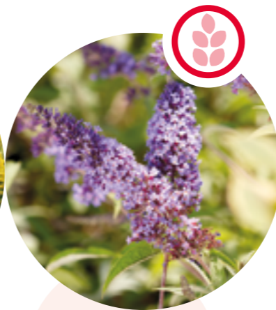
Sommerflieder Buddleja davidii

Herkunft: Nordamerika Blütezeit: Juli bis Oktober