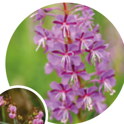
Tipp 2: Wald-Weidenröschen statt Springkraut