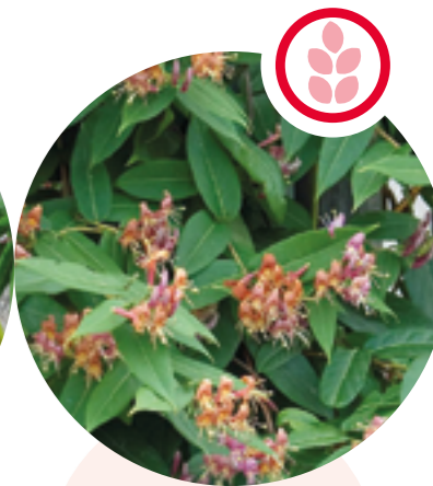
Asiatische Geissblätter Lonicer henryi und japonica

Herkunft: China Blütezeit: Juni bis Juli