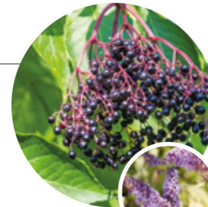
Tipp 3: Holunder statt Sommerflieder