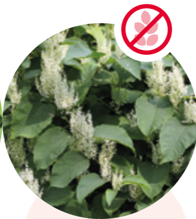
Asiatische Staudenknöteriche Reynoutria japonica, R. sachalinensis etc.

Herkunft: Nordamerika Blütezeit: Mai bis Juni