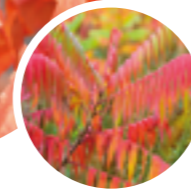
Tipp 5: Vogelbeere statt Essigbaum