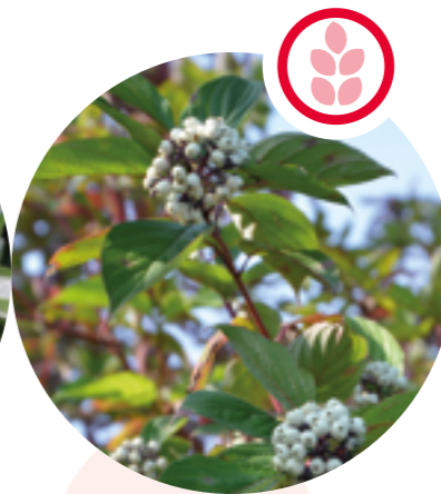
Seidiger Hornstrauch Cornus sericea

Herkunft: Südwestasien Blütezeit: April bis Mai