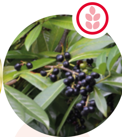
Kirschlorbeer Prunus laurocerasus

Herkunft: China Blütezeit: Juli bis August