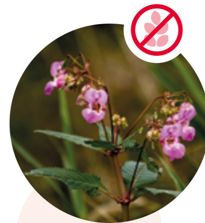
Drüsiges Springkraut Impatiens glandulifera