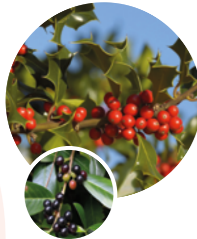
Tipp 1: Stechpalme statt Kirschlorbeer