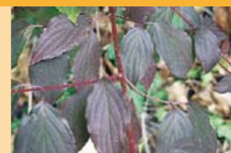
Roter Hartriegel Cornus sanguinea