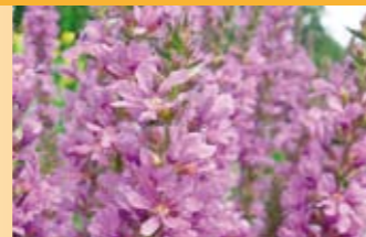
Blutweiderich Lythrum salicaria