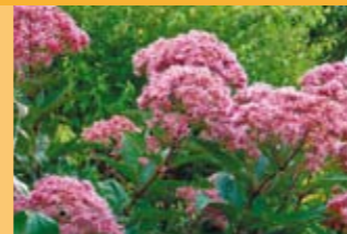
Gewöhnlicher Wasserdost Eupatorium cannabinum