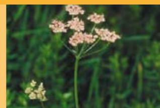
Grosse Bibernelle Pimpinella major