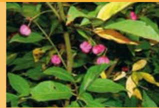
Pfaffenhütchen Evonymus europaeus