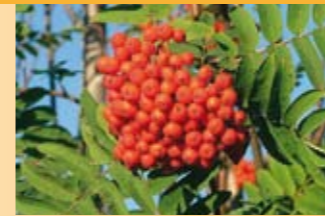
Vogelbeere Sorbus aucuparia