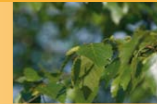
Birke Betula pendula