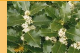
Stechpalme Ilex aquifolium