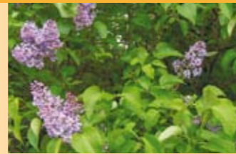
Gemeiner Flieder Syringa vulgaris