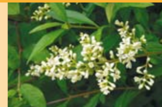
Gemeiner Liguster Ligustrum vulgare