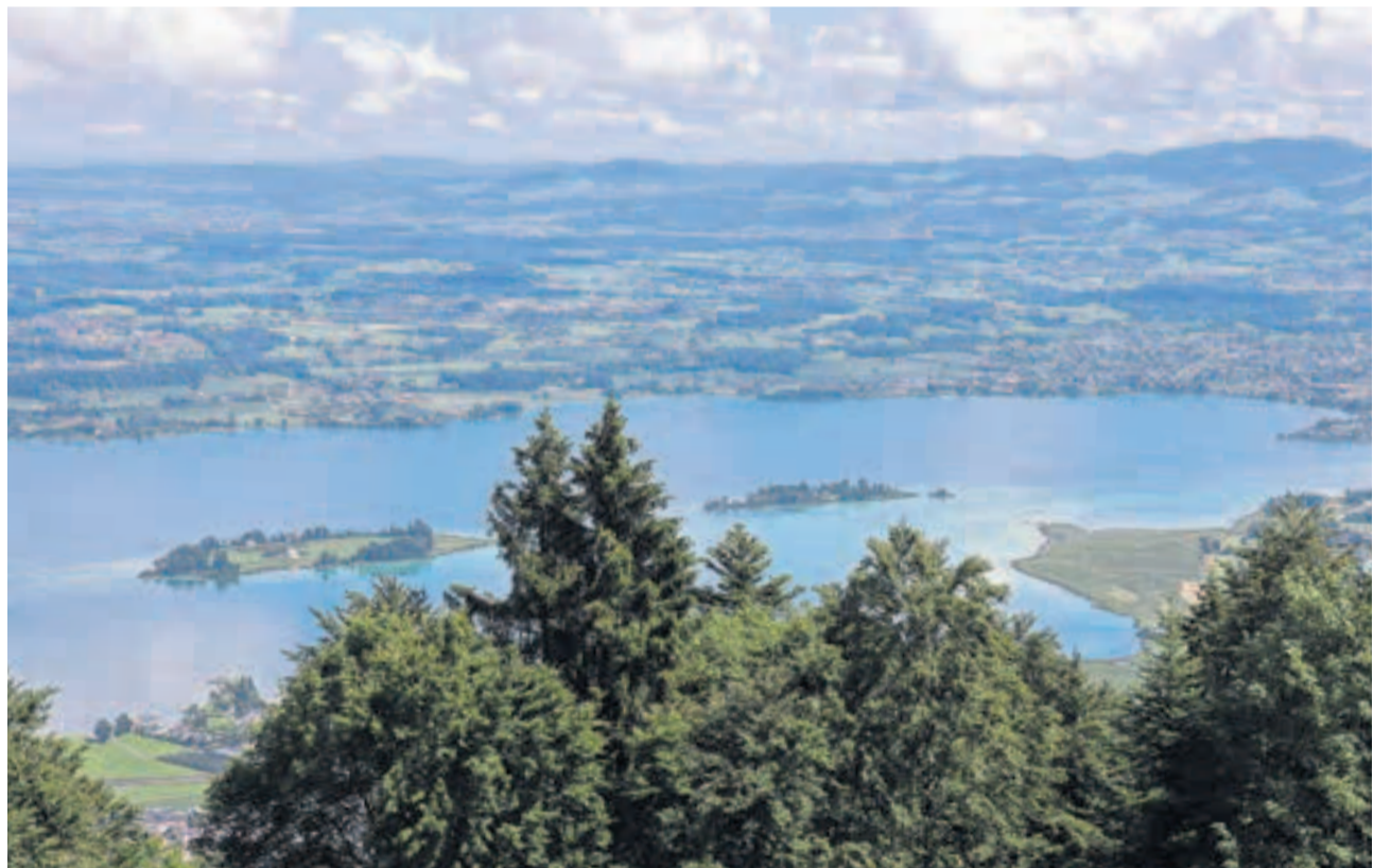
Auf dem Weg zum Hoch-Etzel eröffnet sich ein herrlicher Blick auf den oberen Zürichsee mit Ufnau und Lützelau.